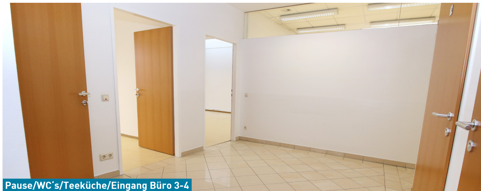
Pause/WC's/Teeküche/Eingang Büro 3-4