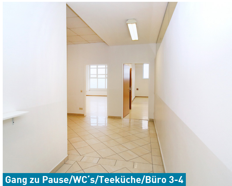
Gang zu Pause/WC's/Teeküche/Büro 3-4