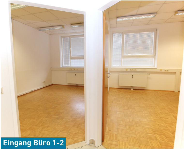
Eingang Büro 1-2